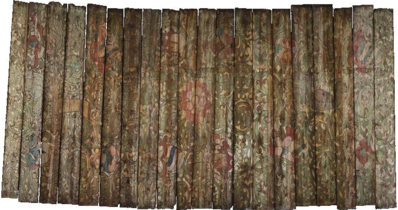
Deski stropowe z kościoła św. św. Szymona i Judy Tadeusza w Kozach ok. 1520 tempera, deska

Strop to konstrukcja, która oddziela piętra budynku – taka warstwa wzmacniająca między sufitem jednego piętra a podłogą drugiego. Spójrz, jak dekoracyjny jest strop z drewnianego kościoła w miejscowości Kozy (koło Bielska-Białej). Możesz dostrzec namalowane temperą na deskach postaci świętych: Katarzyny, Barbary, Urszuli, Wawrzyńca, Szczepana, herby oraz dekoracje roślinne i zwierzęta.